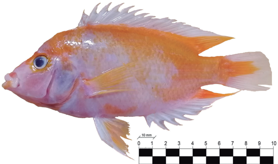
Figura 1. Especímenes de Amphilophus citrinellus presentando las dos coloraciones comunes en la presa de Hatillo, provincia Sánchez Ramírez, República Dominicana.