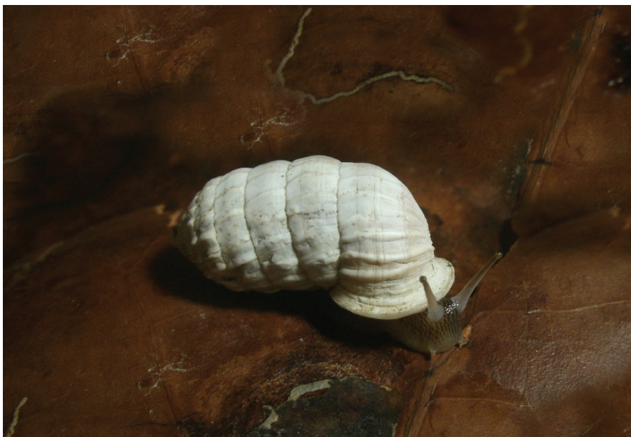
Figura 2. Ejemplar vivo de Cerion milerae sp. nov.