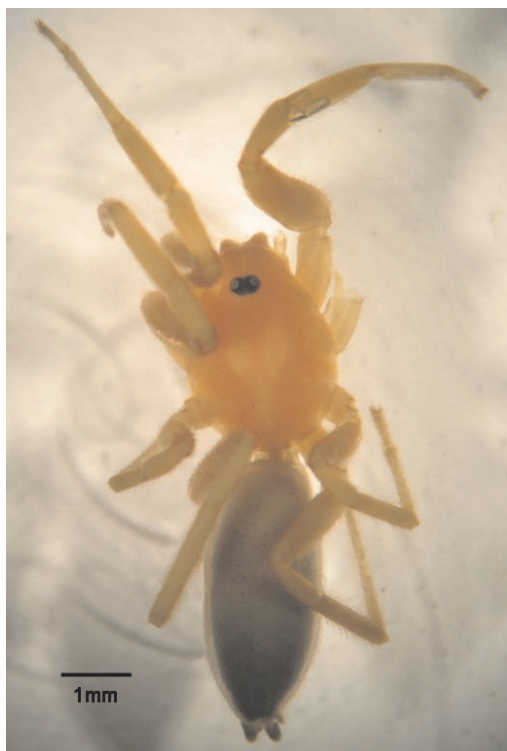
Figura 2. Fotografía del macho holotipo de N. virginicus sp. nov.